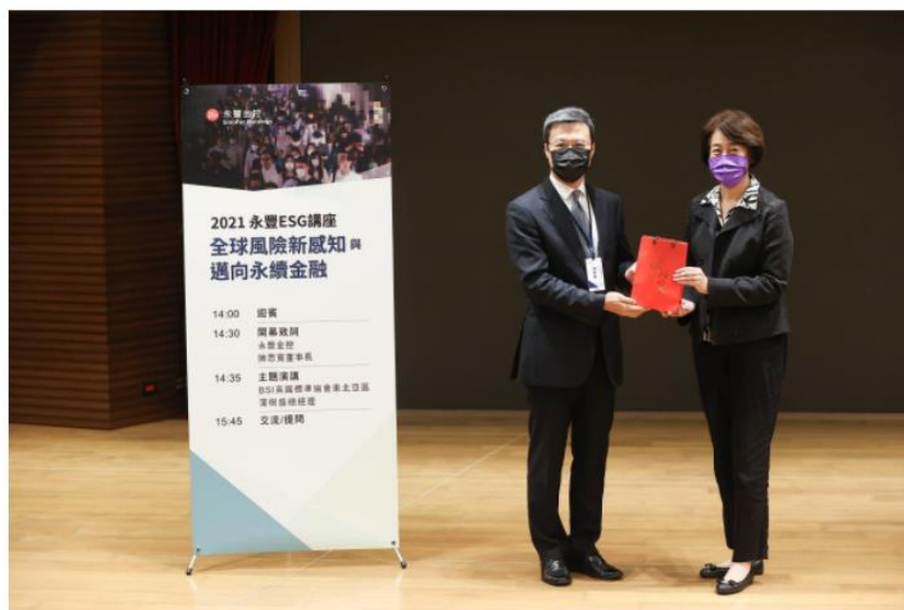
2021 年永豐 ESG 講座照片